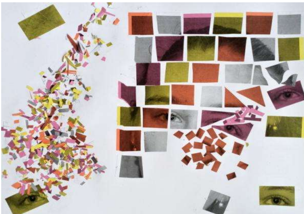
Miroslav Huptych, cyklus Labyrint světa a ráj srdce - Poutník přišel mezi filozofy (2017), koláž (počítačová grafika)